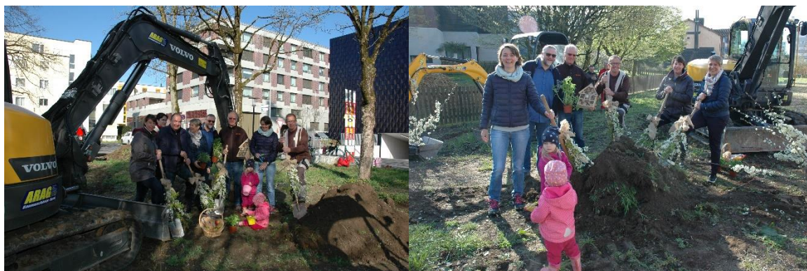
Fotos vom Spatenstich am 9. April 2019