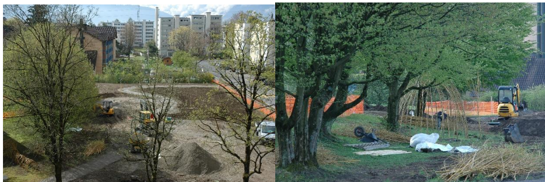
Stand 09. Mai 2019